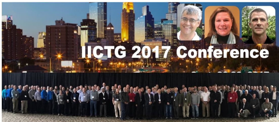
图 2 第一届国际智能建设会议于 2017 年在美国明州召开。