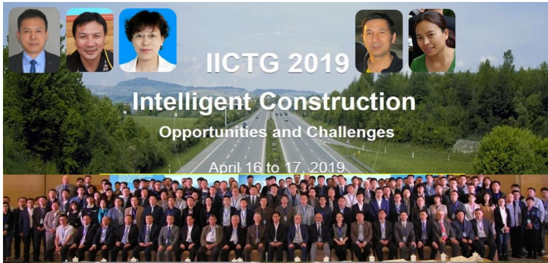
图 3 第二届国际智能建设会议于 2019 年在中国北京召开。IICTG 更名为 ISIC。