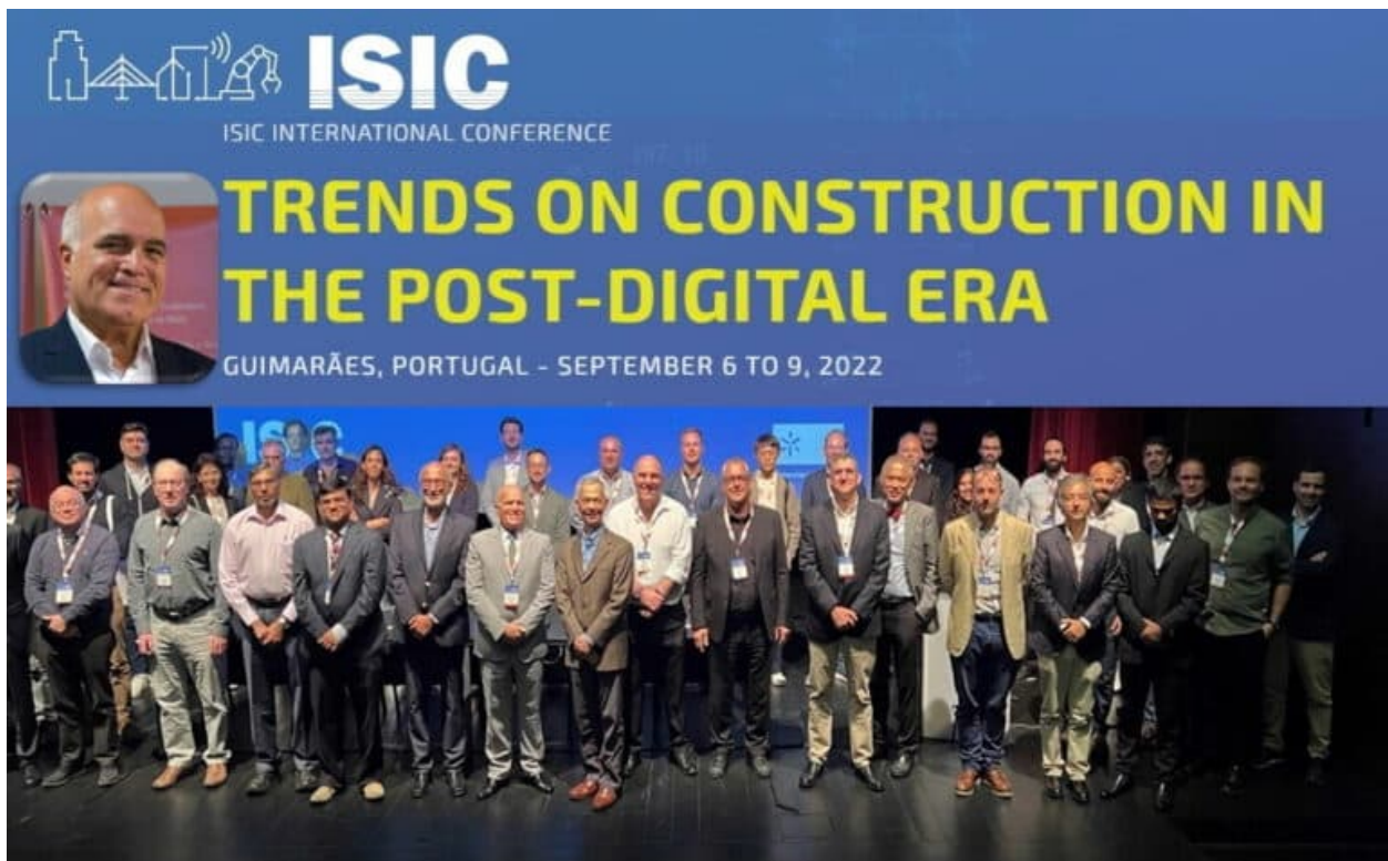
图 4：第三届国际智能建造大会于 2022 年在葡萄牙吉马良斯举行。