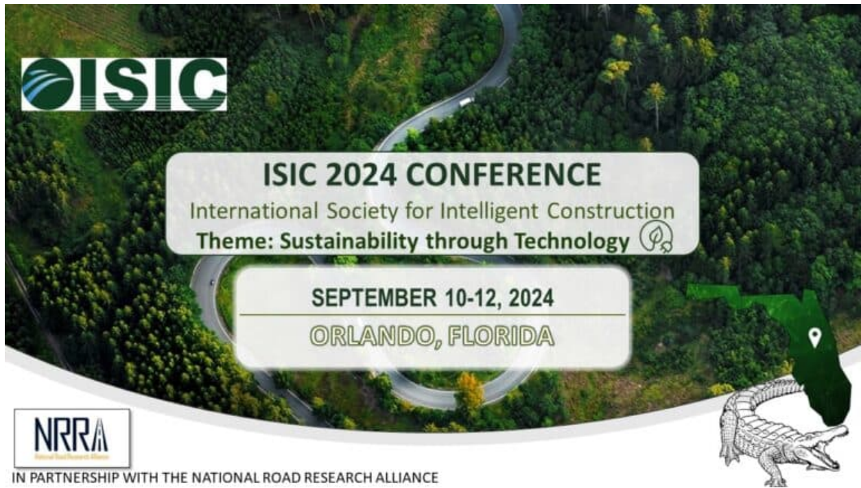
图 5：第四届国际智能建造大会于 2024 年在美国佛罗里达州奥兰多举行。